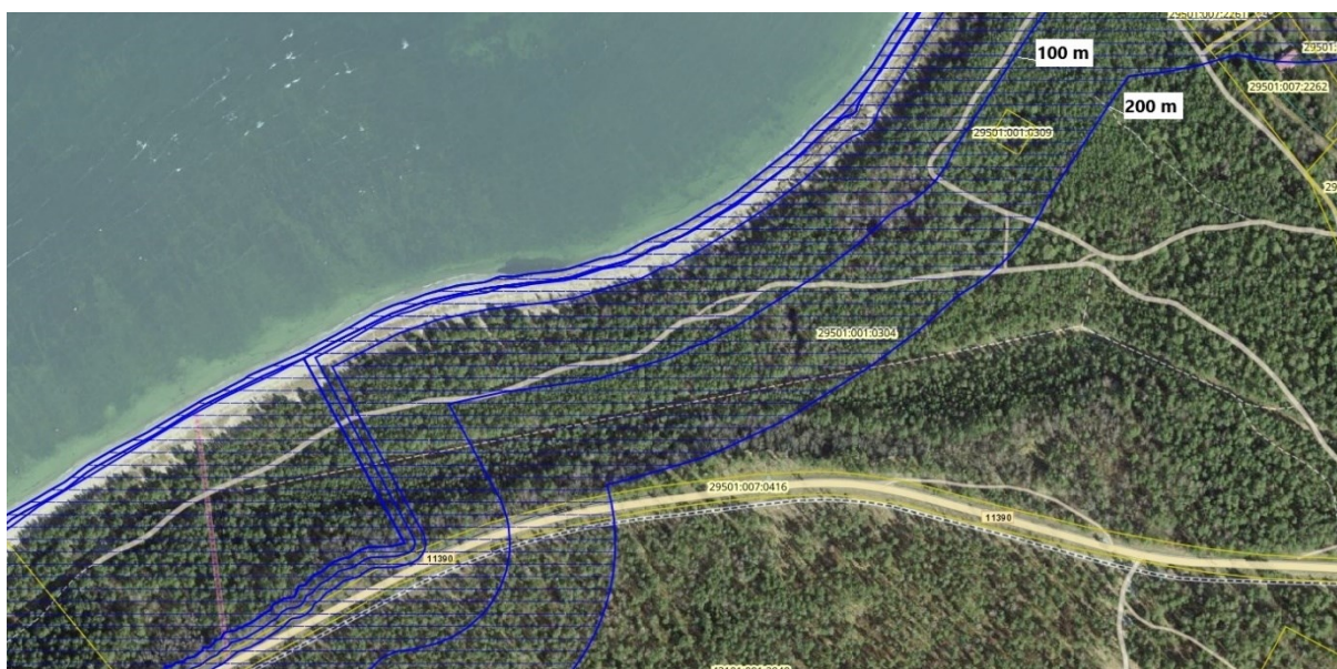
Joonis 2. Ranna ehituskeelu- ja piiranguvöönd - märgitud sinise viirutusega.

Ehituskeeluvööndis on keelatud uute rajatiste ehitamine 5 . Antud juhul ei rakendu ka ükski LKS § 38 lg 4-6 välja toodud erisustest ehituskeeluvööndisse ehitamiseks.